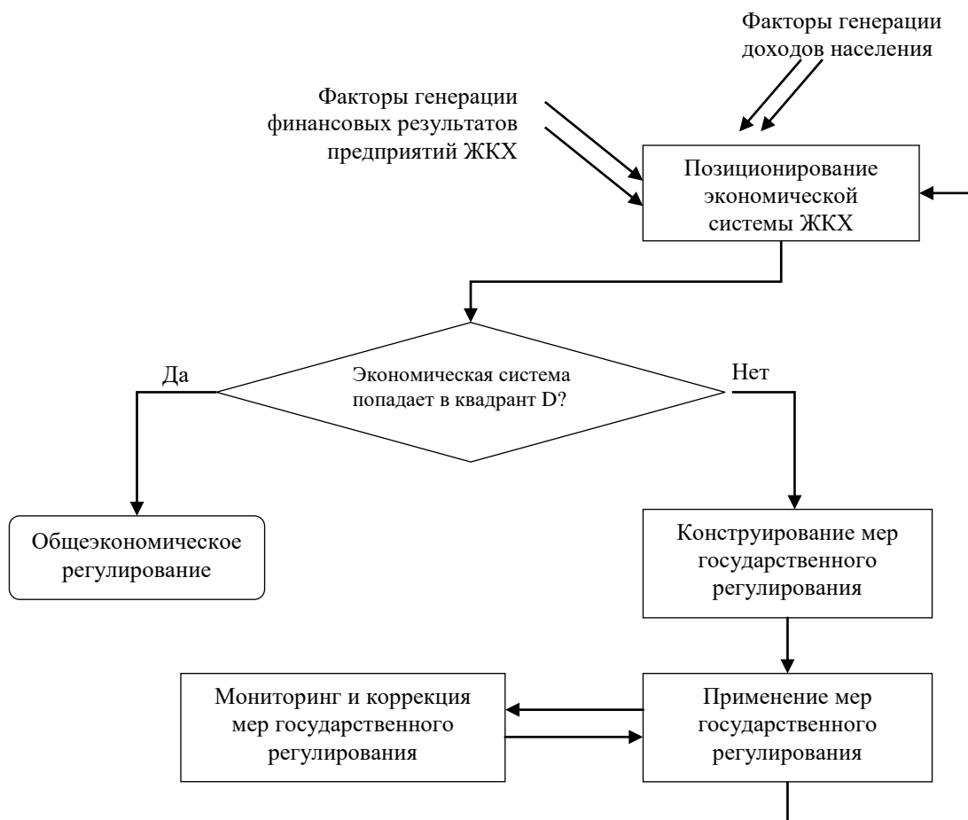
Рисунок 2 – Алгоритм формирования мер государственной регулятивной политики (разработано автором)

На рисунке 2 представлен алгоритм, который регламентирует процедуру типологизирования экономических систем и критерии прекращения государственного вмешательства в процесс развития сферы регионального жилищно-коммунального хозяйства нерыночными методами. Этот алгоритм является элементом верификации третьей гипотезы исследования – для максимизации эффективности государственного регулятивного воздействия на сферу ЖКХ следует использовать институциональные основы, дающие возможность дифференцировать регулятивное воздействие на систему в зависимости от параметров динамики спроса и предложения.