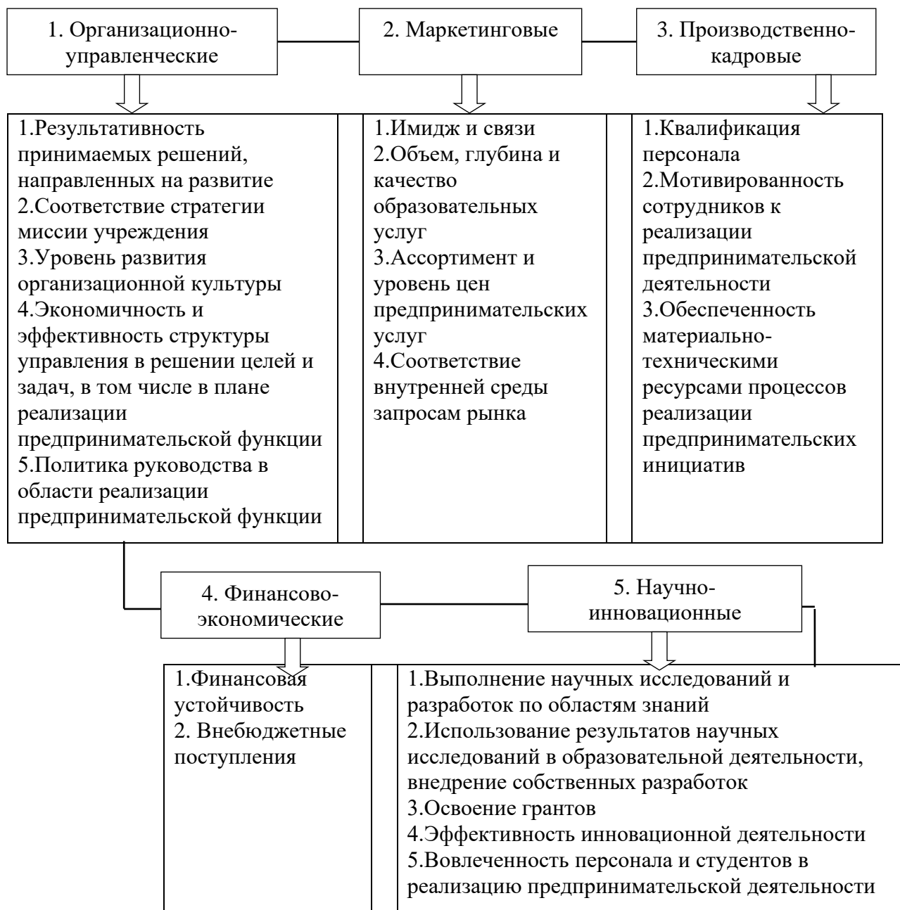
Рисунок 1 – Факторы, обуславливающие развитие социального предпринимательства вузов (предложено автором)

Содержательные характеристики социального предпринимательства во взаимосвязи с группами факторов, обуславливающих развитие социального предпринимательства вузов, позволяют сделать вывод о том, что социальное предпринимательство в сфере высшего образования представляет собой проектно-ориентированный способ осуществления образовательного, научно-технологического и экономического видов деятельности вуза с применением передовых цифровых технологий, который обеспечивает прорыв в социально-экономической и научно-технологической сферах региона и государства.