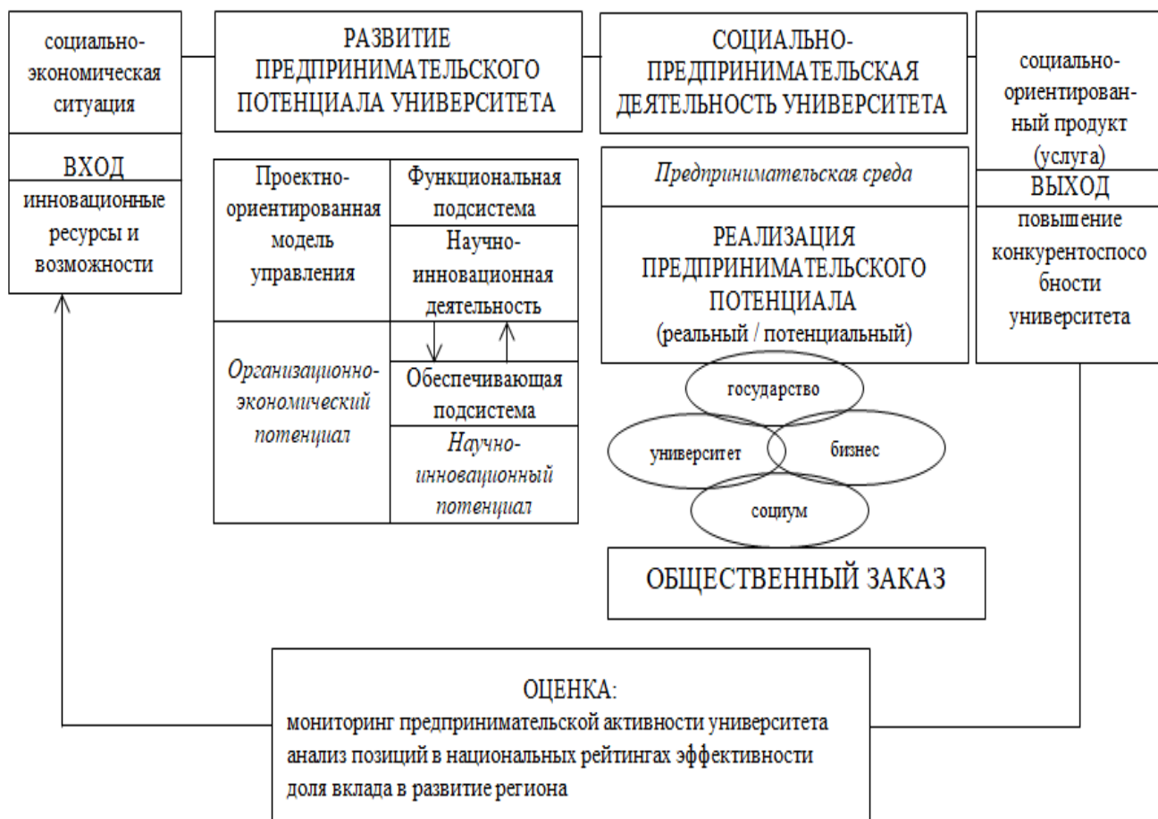
Рисунок 2 – Составляющие концептуальной модели вуза социально-предпринимательского типа (разработано автором)

предпринимательства; повышается уровень эффективности деятельности вуза. Основное ее отличие от модели классических вузов в том, что работа такого университета строится на системной интеграции преподавательской, научно-исследовательской, а также предпринимательской деятельности. Вузы имеют в составе своей структуры объекты инновационной инфраструктуры, являются социально ориентированными.