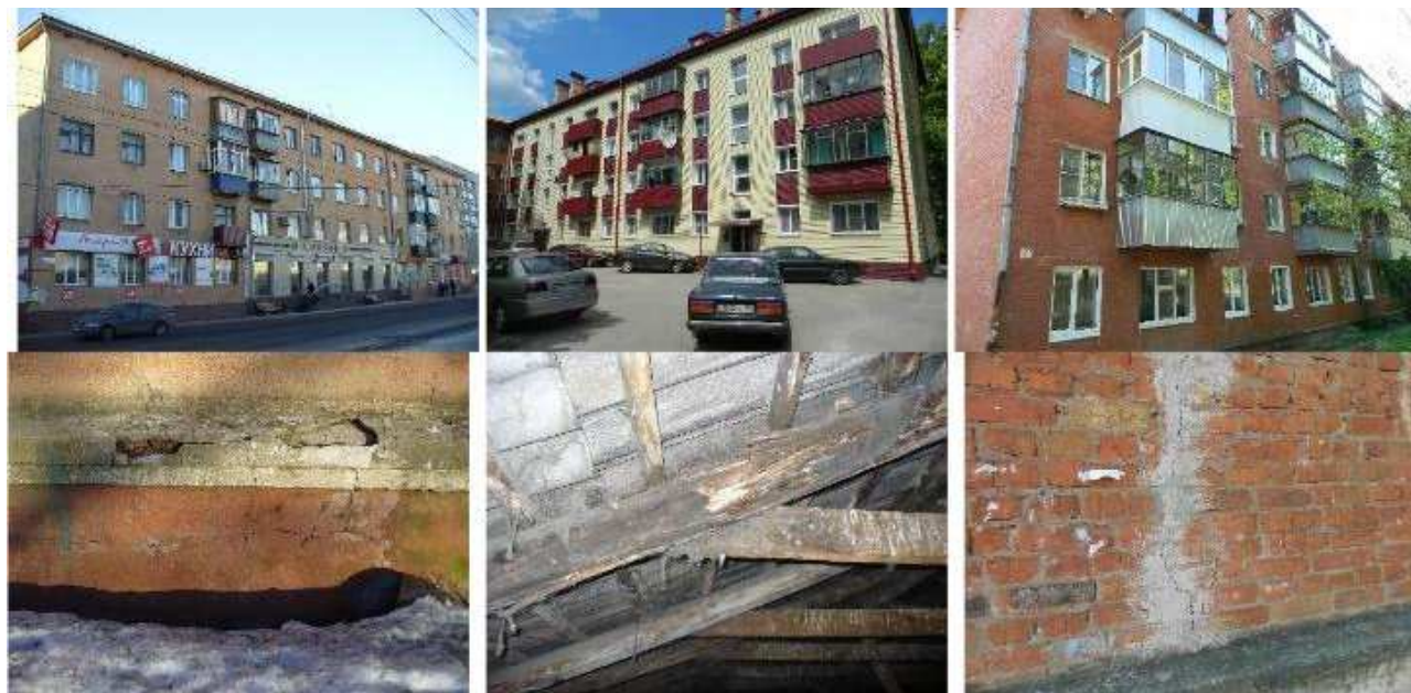
Рис. 1. Материалы фотофиксации объектов обследования и их дефектов

На основании выявленных при обследовании дефектов был определен физический износ основных конструкций здания и выявлено текущее техническое состояние здания (табл. 2). Так, техническое состояние жилых зданий по адресу: ул. Радищева, 84 и ул. Л. Толстого, 7Б в целом на момент обследования следует охарактеризовать как ограничено-работоспособное, а техническое состояние жилого здания по адресу: ул. Дружбы, 1 – как работоспособное. На основе анализа выявленных дефектов были даны рекомендации и разработаны мероприятия капитальных и ремонтно-восстановительных работ.