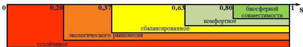
Рис. 3. Состояние комплексной безопасности инженерно-строительных объектов