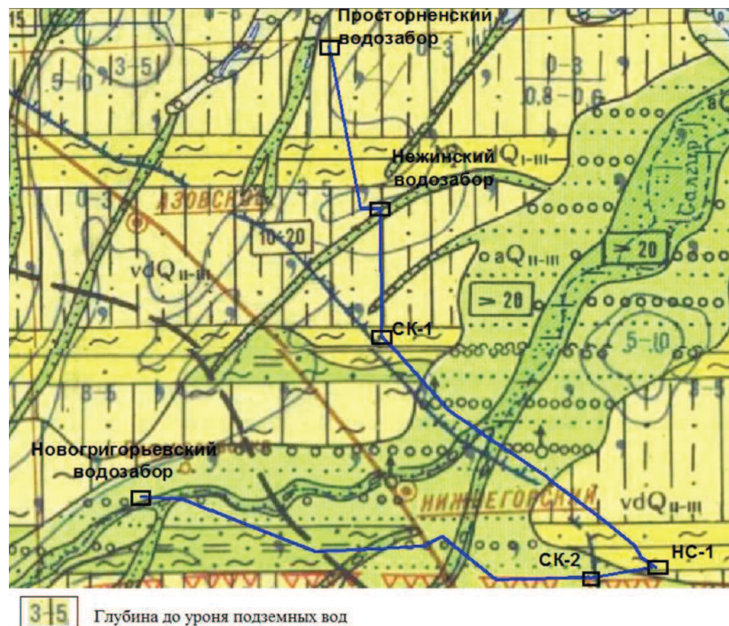
Рис. 1 Гидрогеологическая карта-схема района работ

Северо-Крымский канал — самая длинная в Европе «рукотворная река» от Каховки до Керчи, протяженностью более 400 километров. Кроме того, это основной источник питьевого водоснабжения для большинства районов Крыма, в том числе и Нижнегорского района (рис. 1).