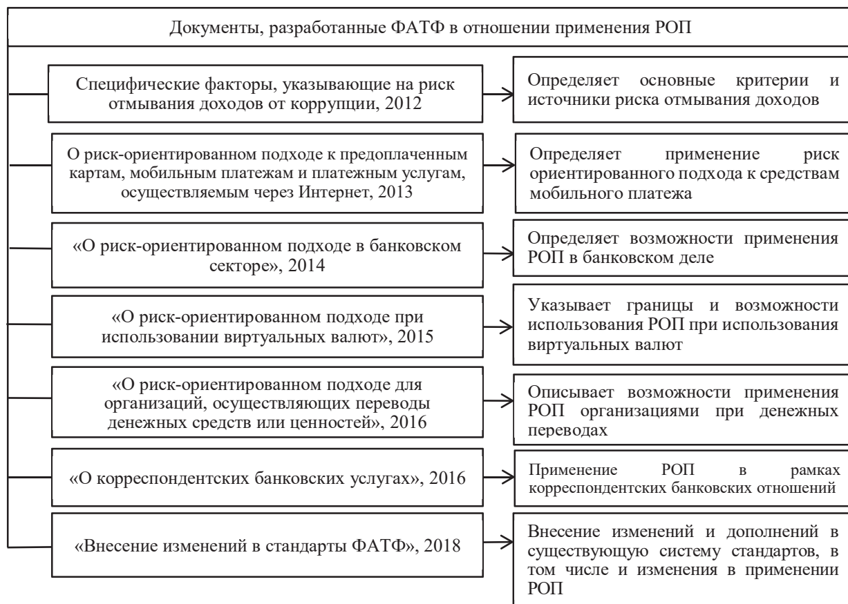
Рис. 4. Документы, принимаемые ФАТФ по развитию риск-ориентированного подхода

развитие в ряде документов, принятых международными органами и объединениями, специализирующимися на вопросах ПОД/ФТ» [11].