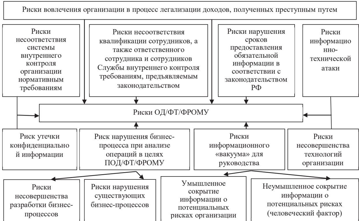
Рис. 3. Взаимосвязь рисков вовлечения организации в процесс легализации преступных доходов и рисков ОД/ФТ/ФРОМУ

В документах ФАТФ выделены две группы факторов возникновения риска легализации: 1) внешняя среда и клиенты; 2) изъяны и недостатки системы внутреннего контроля в целях ПОД/ФТ/ФРОМУ. Помимо факторов возникновения риска, дополнительной характеристикой риска легализации являются последствия его проявления (рис. 3).