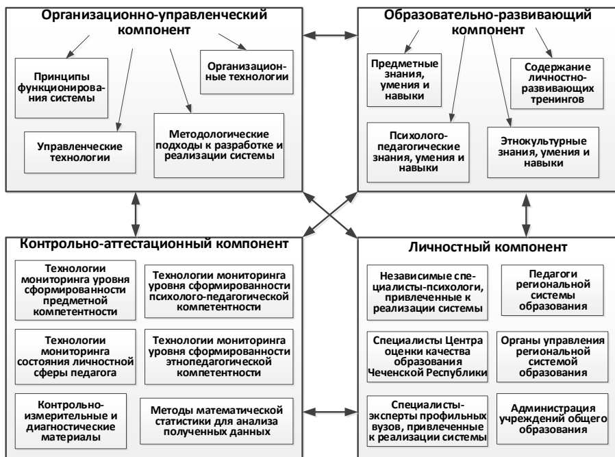
Рис. 1. Структурная модель региональной системы сопровождения профессиональной деятельности педагогов

Эффективное функционирование региональной системы образования зависит от уровня компетентности региональных педагогов, их эмоционального, психологического и физического состояния. Систематическое определение этого состояния и его возможная корректировка в случае необходимости составляют цель предлагаемой системы, которая направлена одновременно на регулирование кадрового состава и совершенствование его компетентности посредством повышения квалификации. Если уровень сформированности предметной, педагогической, психологической, методической и этнопедагогической психологической, методической и этнопедагогической компетентности определяется как недостаточный для выполнения должностных обязанностей, педагог начинает работать в системе сопровождения профессиональной деятельности педагогических кадров региона.