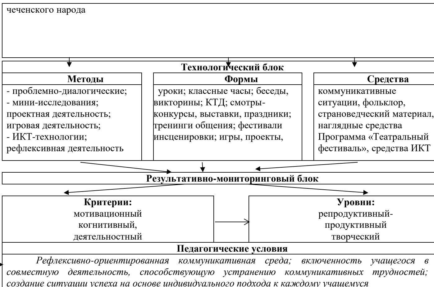
Рисунок 1. Модель эффективного формирования коммуникативных УУД учащихся младших классов

Разработка данной модели основана на идеях интеграции народных традиций и инновационных форм обучения и воспитания в разновидностях совместной деятельности. В качестве образовательно-коммуникативной технологии формирования коммуникативных УУД в младшем школьном возрасте модель будет успешно функционировать в педагогических условиях, обеспечивающих ее результативность в аспекте личностного развития учащегося младших классов, в частности, развития коммуникативных универсальных учебных умений.