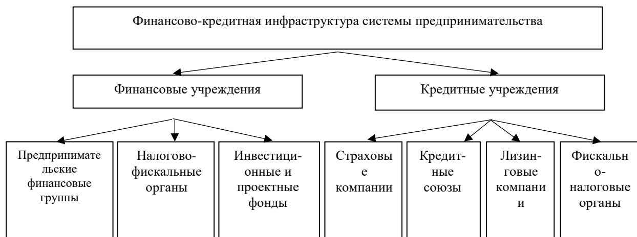
Рис. 1. Субъекты финансово-кредитной инфраструктуры предпринимательства

Для получения финансового лизинга предприятиям необходимо представить руководству лизинговой компании эффективный инвестиционный проект с быстрой окупаемостью затрат и документацию о наличии ликвидного залога. С этой целью в регионах России в целом, и в Крыму в частности создана Всероссийская ассоциация лизинга «Рослизинг», Объединенная Лизинговая ассоциация, КАМАЗ-Линзинг и т.п.