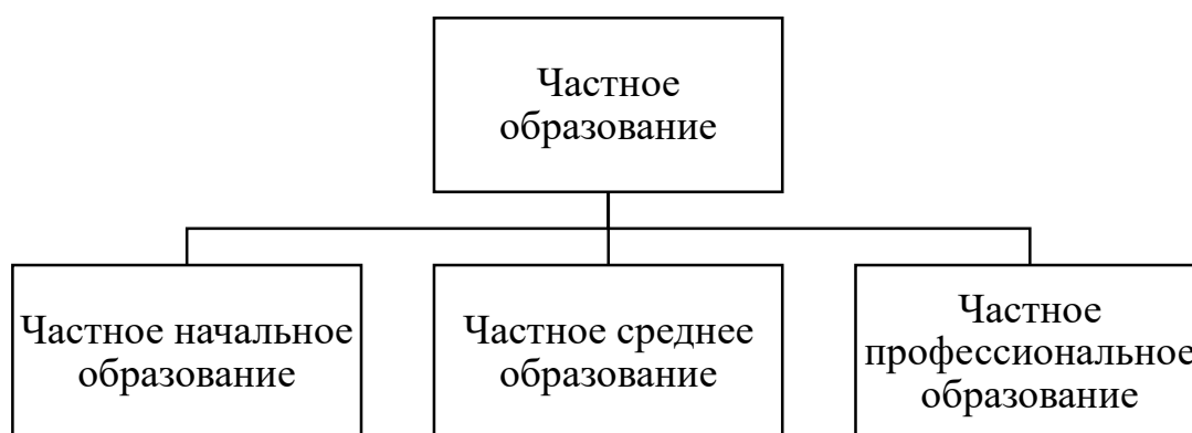
Рисунок 1 – Уровни частного образования в Крыму в исследуемый период

Уровни частного образования в Крыму в исследуемый период образования приведена на рисунке 1.