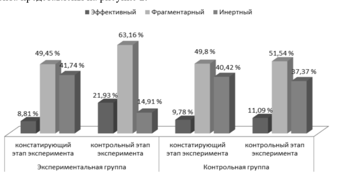
Рисунок 2. – Обобщенные количественные результаты констатирующего и контрольного этапов эксперимента

Сравнительные результаты констатирующего и контрольного этапов эксперимента представлены на рисунке 2.