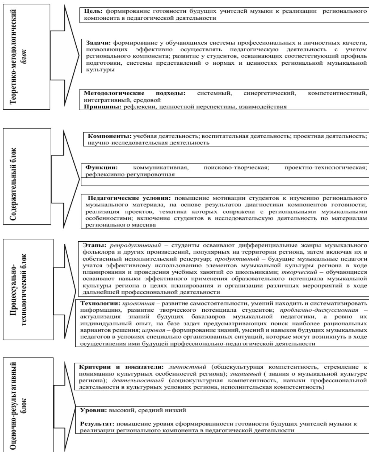
Рисунок 1 – Модель процесса формирования готовности будущих учителей музыки к реализации регионального компонента в педагогической деятельности.

Разработанная и обоснованная модель процесса формирования готовности будущих учителей музыки к реализации регионального компонента состоит из четырех блоков: теоретико-методологического (цель, задачи, методологические подходы и принципы); содержательного (компоненты образовательного процесса, функции, педагогические условия); процессуально-технологического (этапы, технологии); оценочно-результативного (критерии, показатели, уровни,