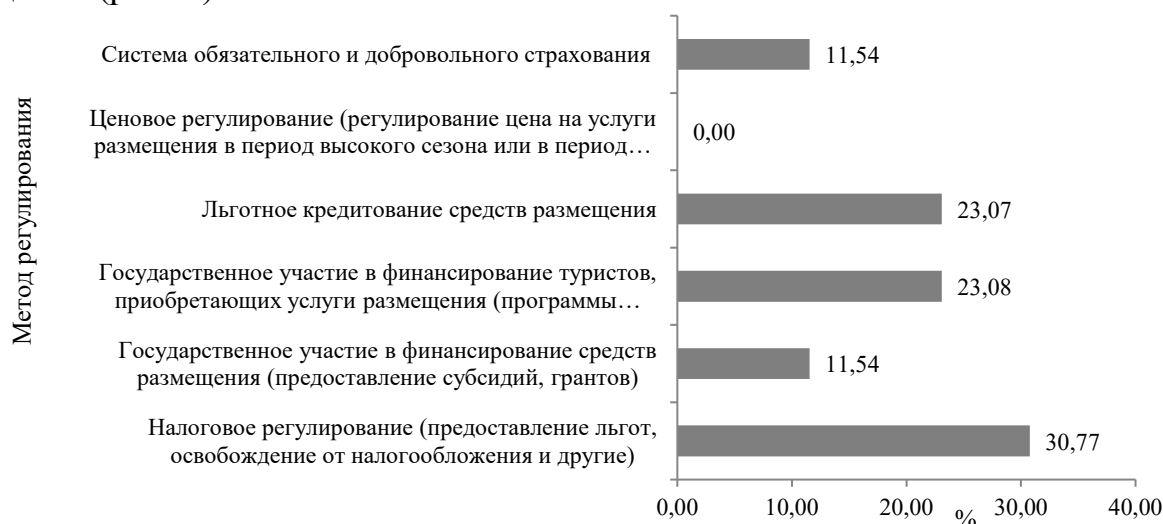
Рисунок 2 – Оценка влияния инструментов экономического регулирования применительно к сфере предоставления услуг размещения, по результатам анкетирования, %

3. Положительное влияние на отрасль оказали следующие инструменты экономического регулирования: налоговое регулирование, государственное участие в финансировании туристов, приобретающих услуги размещения (программы субсидирования проезда и поездок), льготное кредитование средств размещения (рис. 2).