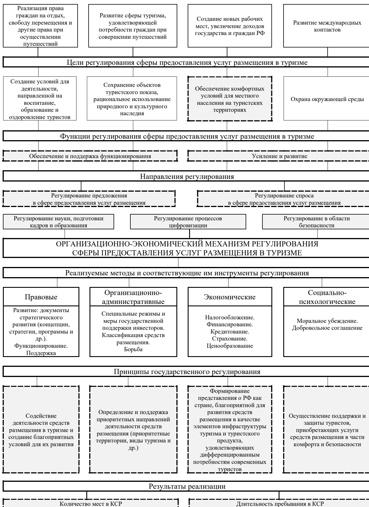
Рисунок 3 – Усовершенствованный организационно-экономический механизм регулирования сферы предоставления услуг размещения в туризме (составлено автором)